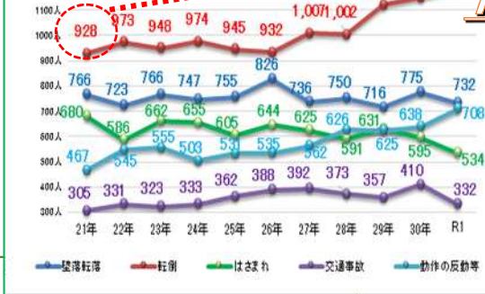
事故の型別・死傷者数